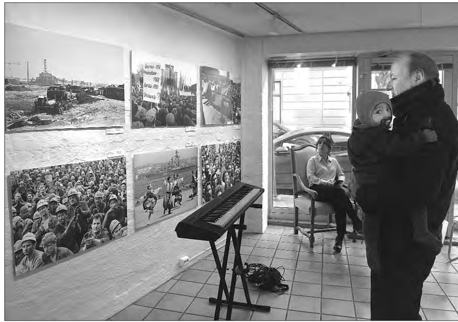
Частина виставки «Боротьба України за волю».